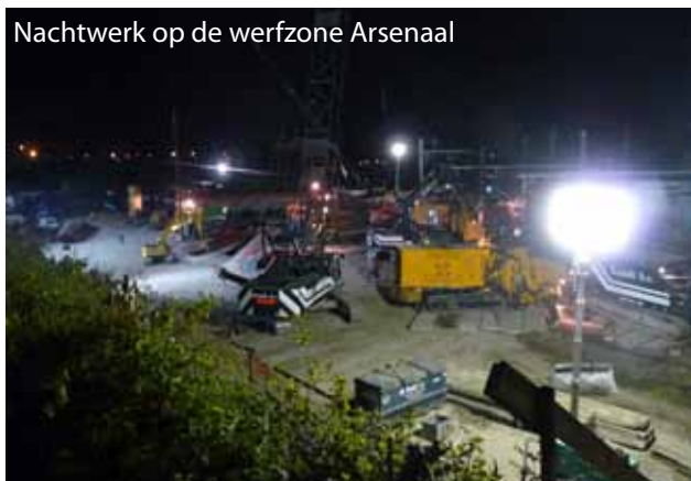
Nachtwerk op de werfzone Arsenaal

Dankzij een nieuwe wielwasinstallatie op de werfzone van de Jubellaan rijden vrachtwagens en tractoren binnenkort met propere banden op de openbare weg. De vuile werfvoertuigen rijden door een sproeimachine. Voordien reed een kuiswagen de wegen proper, maar dat bleek niet voldoende.