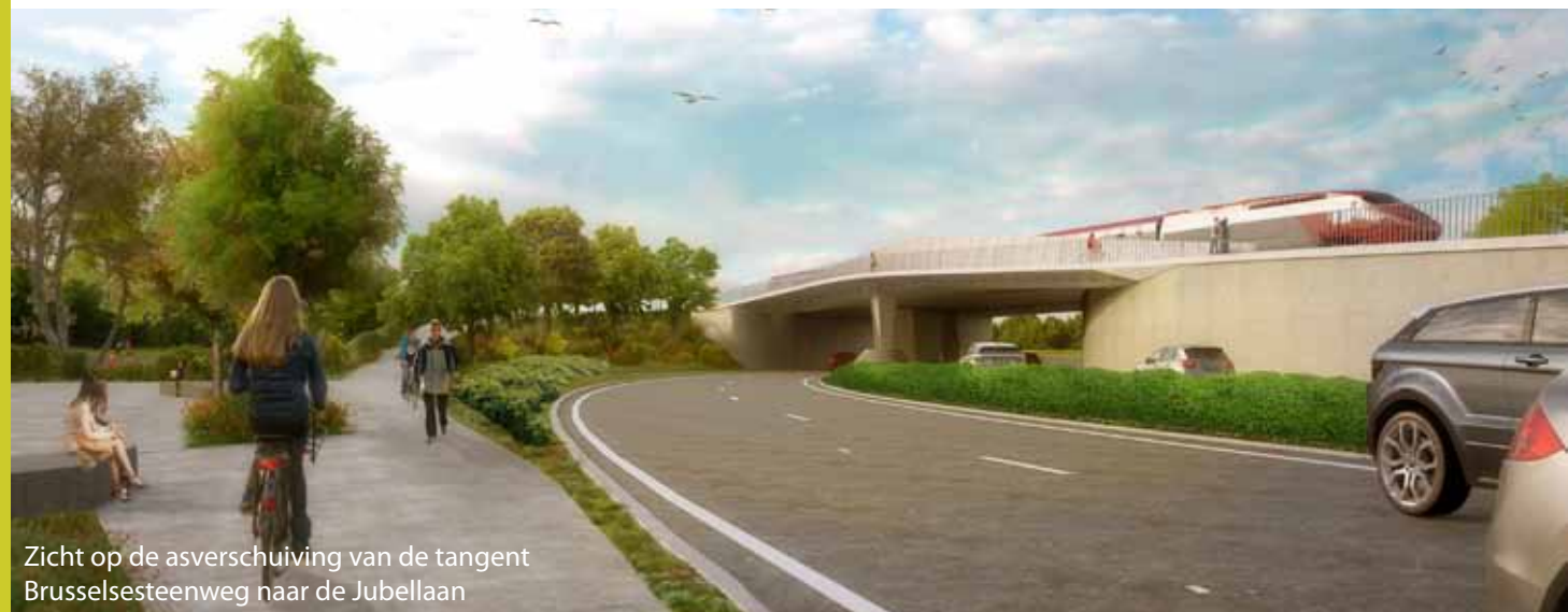
Zicht op de asverschuiving van de tangent Brusselsesteenweg naar de Jubellaan